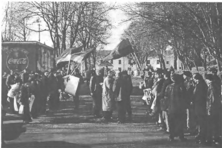
Пікетування учасників Міжнародної конференції щодо польсько-українських взаємин, м. Острів, 2003 р.