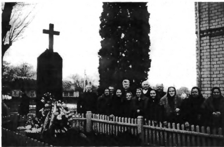
Живі свідки Ремельської трагедії. с. Ремель, Рівненський район, березень 2003 р.