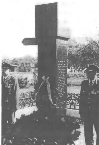
Почесна варта біля пам'ятника воякам УПА Базальтове (с. Янова Долина), Костопільський район, березень 2003р.