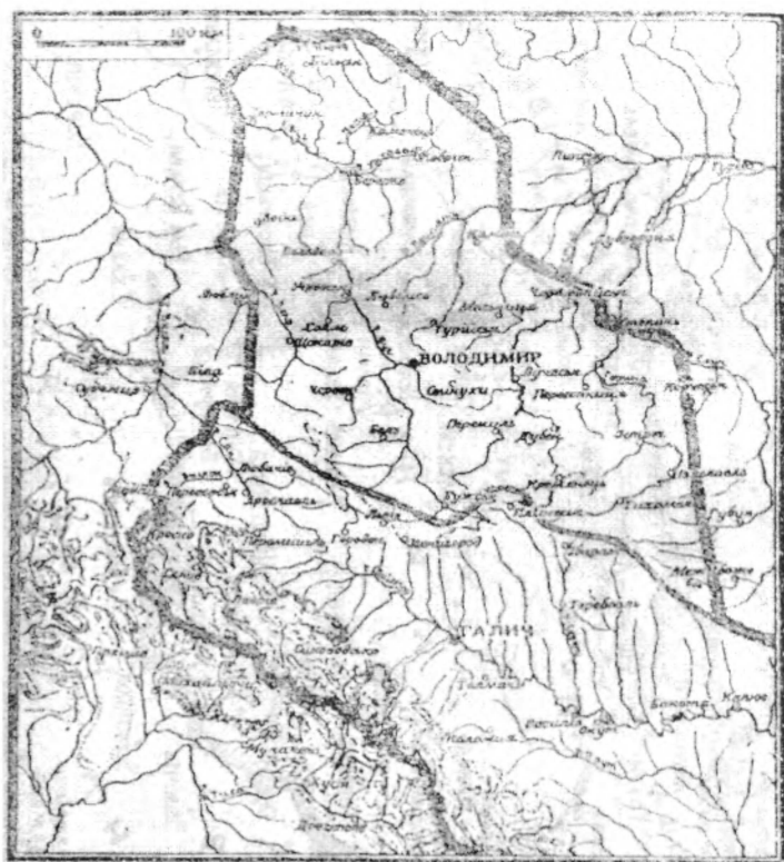
Галицько-Волинська держава в XIII ст.