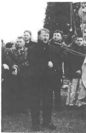
Говорить народний депутат України Василь Червоний після панахиди по виануванню пам'яті жертв Ремельської трагедії