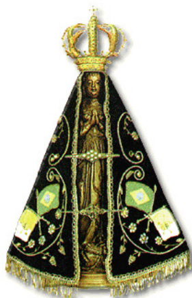
Nossa Senhora Aparecida, rogai por nós!