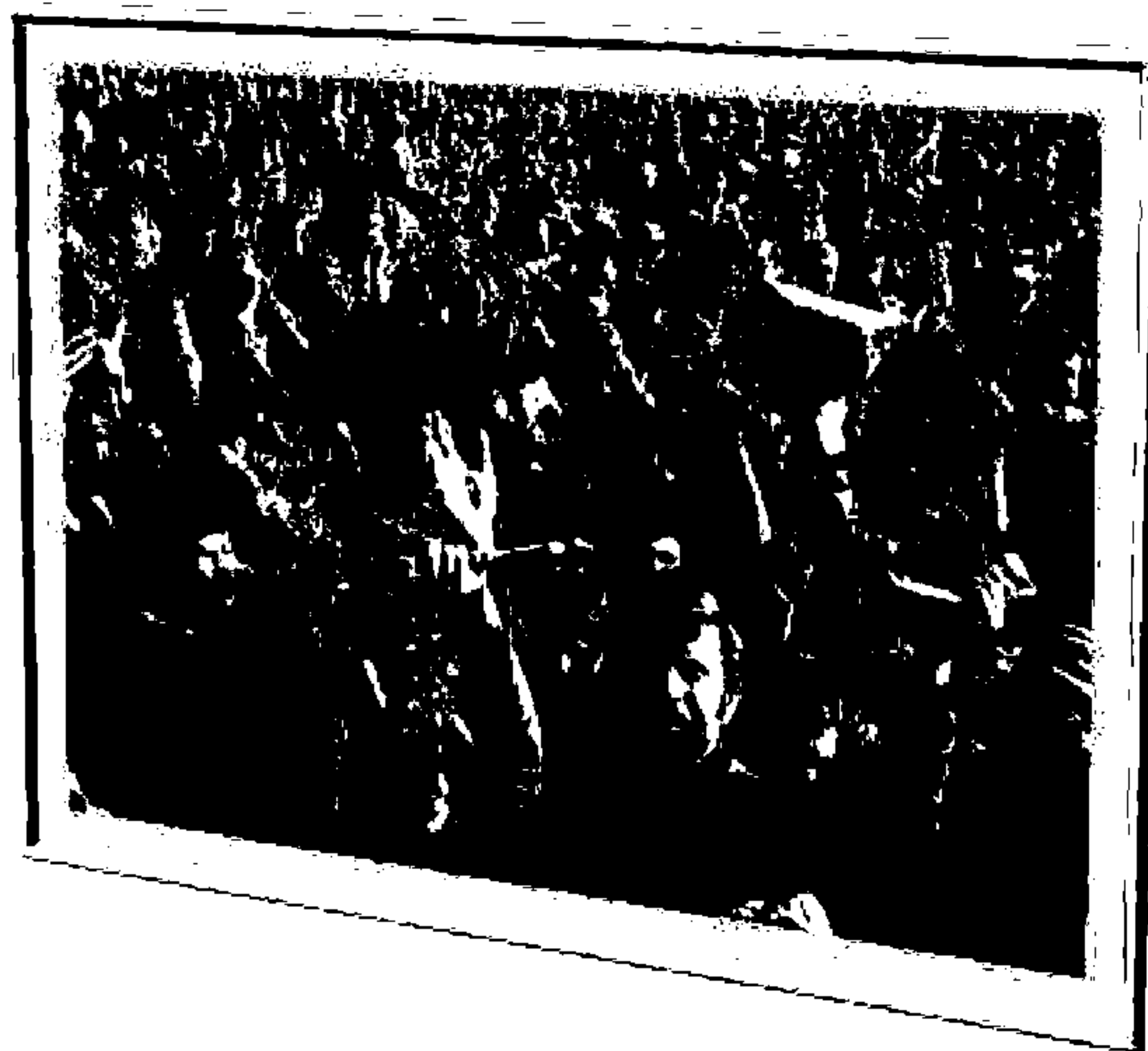
فرتور ۱ - شیعیان در حال عزاداری برای حسین

از همه اینها گذشته، درباره دستورات کشتار در قرآن، چه باید گفت؟ «بکشید، چون به محمد ایمان ندارند. بکشید چون به الله ایمان نمی آورند. بکشید چون به روز جزا اعتقاد ندارند. بکشید، چون به دین اسلام نمی گروند و ...». آیا تمام اینچنین سخنانی توهین به اعتقادات دیگران نیست؟