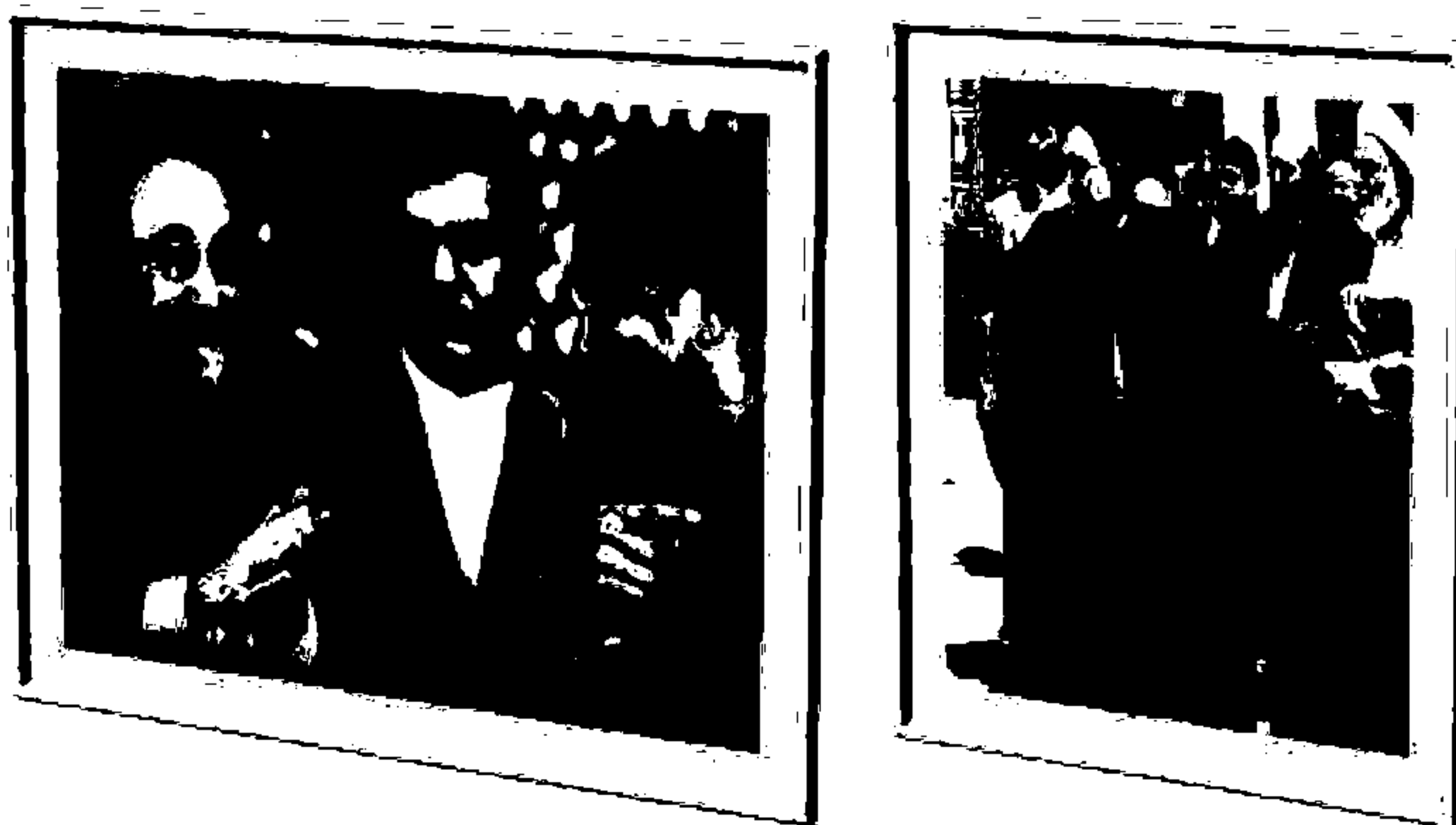
فرتور ۱۵ - فرتور سمت چپ در ماههای حرام گرفته شده و چون خاتمی نمی توانسته چاوز را قتل کند برای او دست زده. فرتور سمت راست پس از ماههای حرام است ولی یک ملا مانع شده است که خاتمی، چاوز را قتل کند!

در یکی از این ماههای حرام به دستور محمد غزوه ای بر ضد یکی از قوم های یهودیان انجام شد. این کار، برخی مسلمانان را به اعتراض واداشت و محمد را از این کار بازخواست نمودند. الله نیز چون همیشه به داد محمد رسید و چنین توجیهی کرد که در بالا آمد.